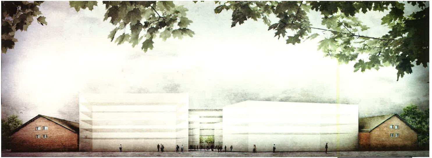
Siegerprojekt Zeughausareal: Visualisierung des Bauvolumens

Eine Herausforderung für die Planungsteams war die Anforderung, den Charakter der denkmalgeschützten Zeughäuser zu respektieren und trotz einer stark veränderten und erweiterten Nutzung die Geschichte des Ortes weiter zu schreiben. Mit der Baustruktur und der Substanz der Zeughäuser soll sorgfältig umgegangen werden. Die Spuren des Zeughausareals sollen auch in Zukunft erkennbar bleiben. Die eingereichten Vorschläge unterscheiden sich vor allem darin, wie die grosse, zusammenhängende, freie Fläche in der Mitte des Areals gestaltet und genutzt wird.